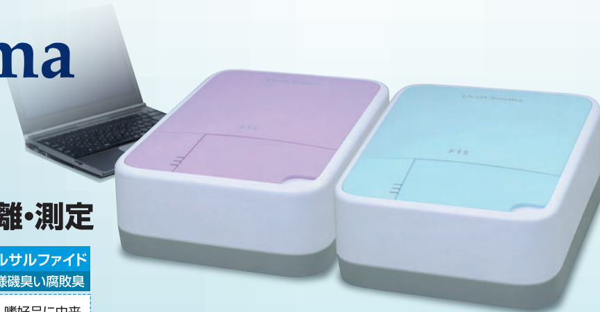
付属品にパソコンは含まれません